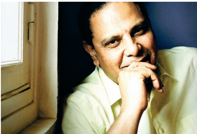
Alaa El Aswany

De par le monde, des écrivains continuent à s'exprimer en dépit d'une situation politique fragile, en particulier du côté du Printemps arabe.