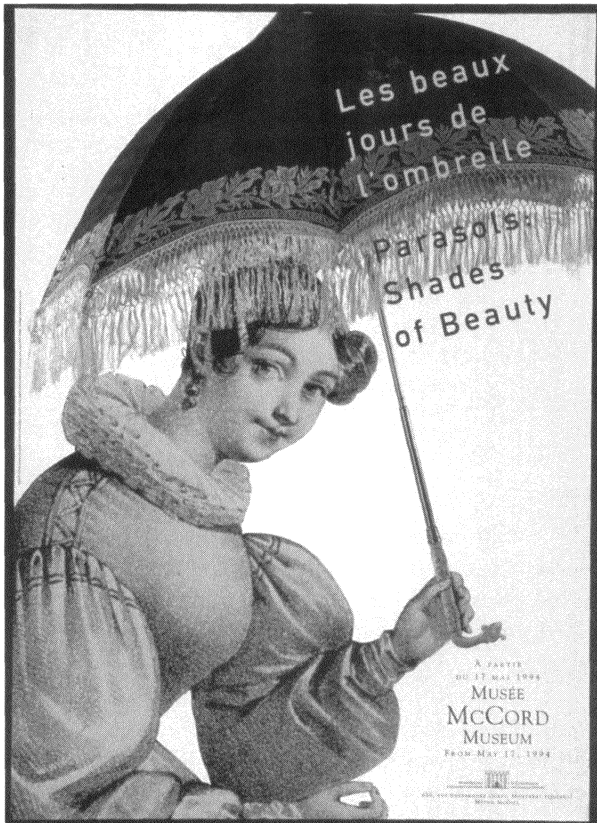
Lumbago communication visuelle, Les Beaux jours de l'ombrelle = Parasols : shades of beauty. Montréal : Musée McCord, 1994. Affiche, 84 x 61 cm.

les échanges de façon significative : les professionnels de la DRÉ, spécialistes de collections ou agents de recherche, ainsi que les boursiers du Programme de soutien à la recherche y communiquent le fruit de leurs travaux intellectuels. Les premiers assurent également une veille scientifique lors de ces rencontres, en observant les orientations de la recherche actuelle afin d'éclairer les décisions institutionnelles concernant ce champ d'activité. Littéraires, historiens et bibliothécaires représentant la BNQ et plusieurs autres institutions se sont ainsi réunis pendant deux jours, lors du congrès de l'ACFAS qui s'est tenu à Montréal en 2003, pour réfléchir à la pertinence et à la faisabilité d'un projet d'inventaire des collections de livres anciens au Québec. Ces échanges ont connu par la suite des développements remarquables et la BNQ a accepté d'apporter à deux groupes de chercheurs, rassemblés autour de nouvelles chaires de recherche à Trois-Rivières et à Rimouski, le soutien de son expertise dans les domaines des milieux documentaires, du traitement documentaire et des livres anciens, afin de contribuer à cet important chantier.