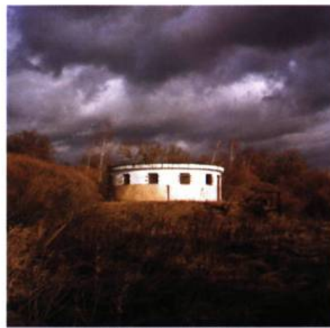
N 51°30'33.5" – EO 23°36'58.2"

plus haut, n'est pas encore au point. Plus de mille caméras permettant de voir la nuit sont déjà en fonction le long des frontières extérieures et il est prévu d'en acheter encore plus de deux cents avant la fin de 2002, dont les fameuses unités mobiles de thermo-vision. Ce sont des bus ressemblant à n'importe quel bus de livraison, disposant de tout un matériel très sophistiqué de détection nocturne. Les voir à l'œuvre est très impressionnant : c'est avec une majesté toute robotique que d'une carrosserie anodine surgit un œil aussi impersonnel qu'inquiétant. Lorsque l'on pénètre dans le corps du cyclope on y découvre des entrailles transparentes de technologie de pointe et de précision. Ce n'est pas sans fierté que les gardes montent à l'écran avec quelle clarté on peut déterminer le sexe et l'âge approximatif d'une personne marchant à plus de dix kilomètres de là... en pleine nuit ! On ne peut s'empêcher de penser qu'au même moment en Roumanie, un malheureux garde est peut-être en train de parcourir à pied et dans le froid la même distance que l'œil électronique vient de survoler en un instant.