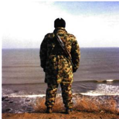
N 43°44'32.3" – EO 28°34'43.9"