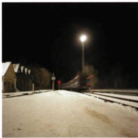
N 59°22'06.7" – EO 28°11'59.0"