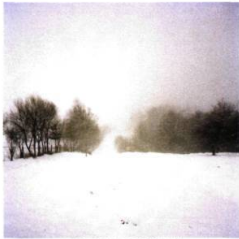
N47°56.50'1" – EO 25°37'14.5"