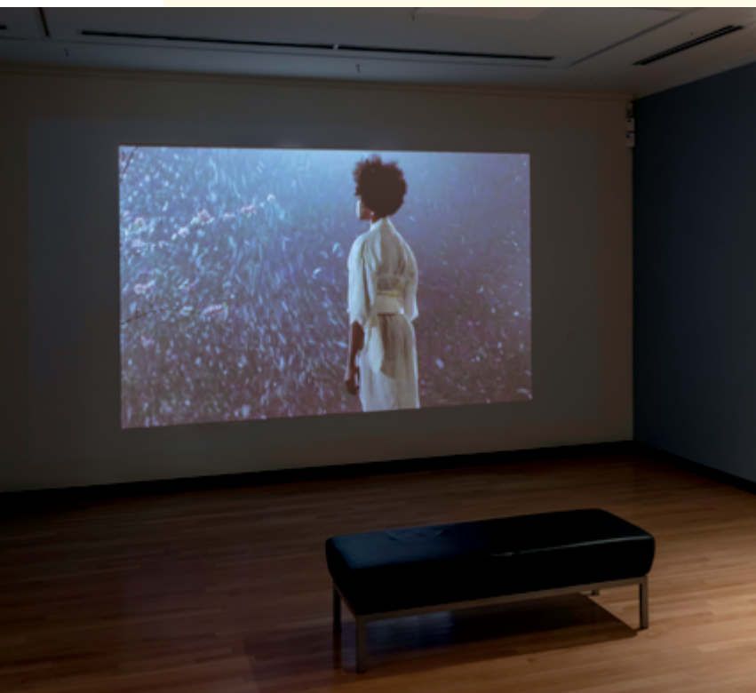
Carrie Mae Weems Constructing History: A Requiem to Mark the Moment , 2008 video installation / installation vidéo, 20 min

Violence runs through our lives, experienced directly or through media representations. We are subject to its power to varying degrees depending on our geographical location, race, class, gender, and access to high-speed internet. We are well acquainted with the variety of ways that humans inflict harm – whether physical, social, or psychological – upon one another. It is not odd, then, that violence appears as a prominent thread within a photography festival. After all, it has been an enduring subject in photography, represented in the medium even before the technology could freeze motion. Despite the absence of actual battle in Roger Fenton's propagandistic Crimean war scenes, the images clearly referenced the destruction; similarly, ethnography pinned the vulnerable, often naked, bodies of its subjects onto photographic papers and plates, forcing their permanent exposure to the racist imperialist gaze. No such uses appeared in the 23rd edition of Toronto's CONTACT Photography Festival; 1 instead, the featured artists used the medium to analyze and critique violence within a range of contexts.