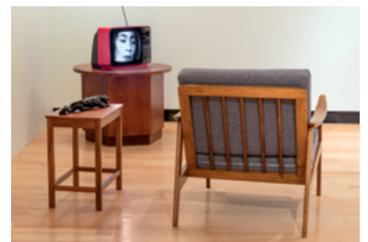
Carrie Mae Weems Heave , installation views / vues d'installation Art Museum at the University of Toronto