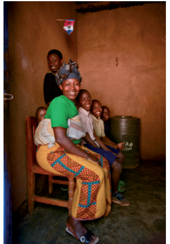
LEFT TO RIGHT TOP TO BOTTOM / DE GAUCHE À DROITE, DE HAUT EN BAS Samer Muscati Faustin , 2018, 76 × 51 cm; Marie Claire , 2018, 91 × 61 cm; Gloriose , 2008, 76 × 51 cm; Marie Louise , 2018, 76 × 51 cm; Hyacintha , 2018, 91 × 61 cm