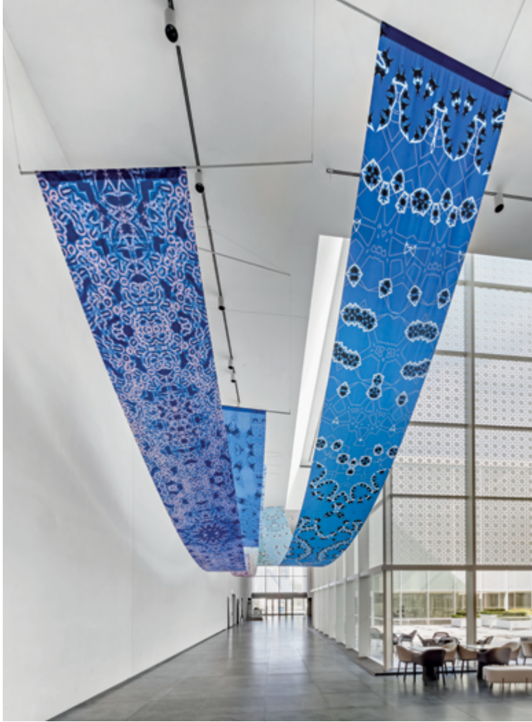
Sanaz Mazinani Not Elsewhere installation view / vue d'installation, Aga Khan Museum detail / détail : Lockheed Martin F-22 Raptor detail / détail : Thunderbird in Performance