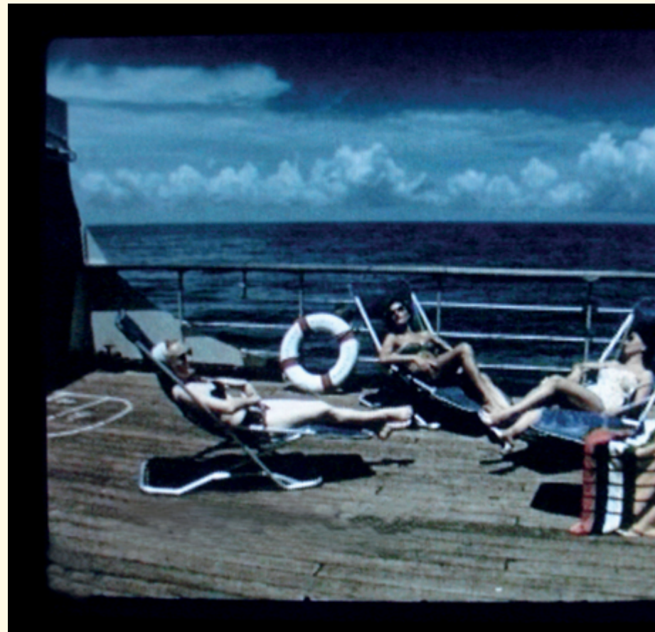
Yto Barrada, Hand-Me-Downs , 2011