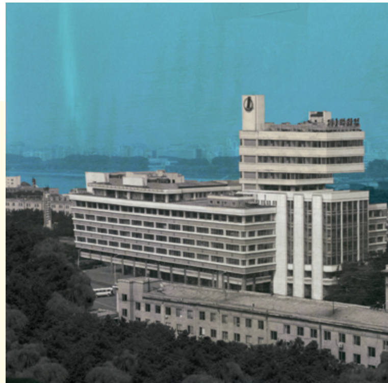
Seung Woo Back, Utopia - UT #022 , de la série / from the series Utopia , 2008