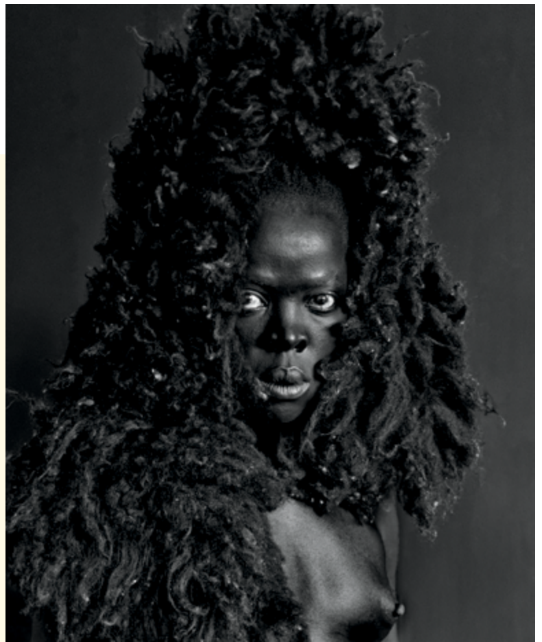
Zanele Muholi, Somnyama IV, Oslo , de la série / from the series Somnyama Ngonyama , 2015