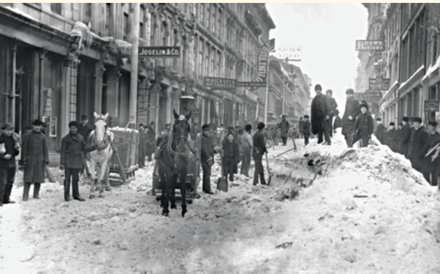
Frédéric Lavoie, Rue Notre-Dame, 1887 , 2013