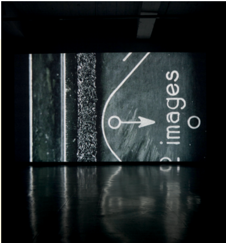
Pascal Grandmaison, The Neutrality Escape , 2008

Pourquoi ne pas tenter d'initier, avec des ressources plus locales, une biennale de l'image anticonformiste qui prendrait à rebrousse-poil le monde de l'art et son marché? D'ailleurs, est-ce possible?