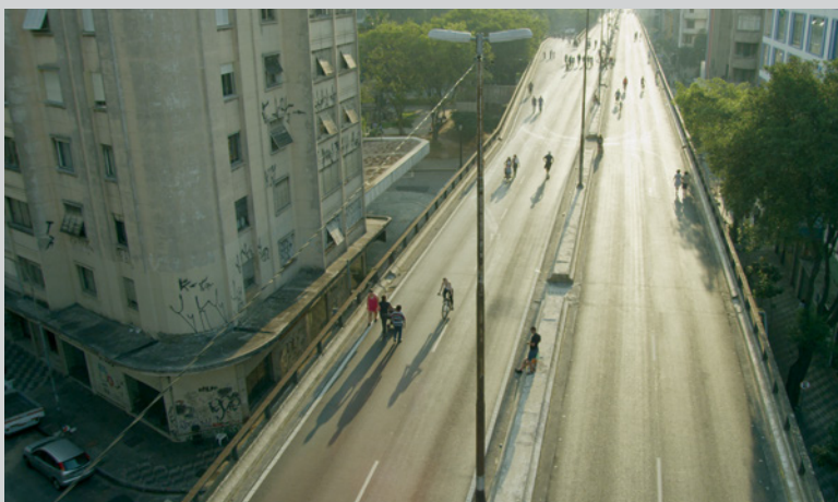
Above and Below the Minhocão , 2014