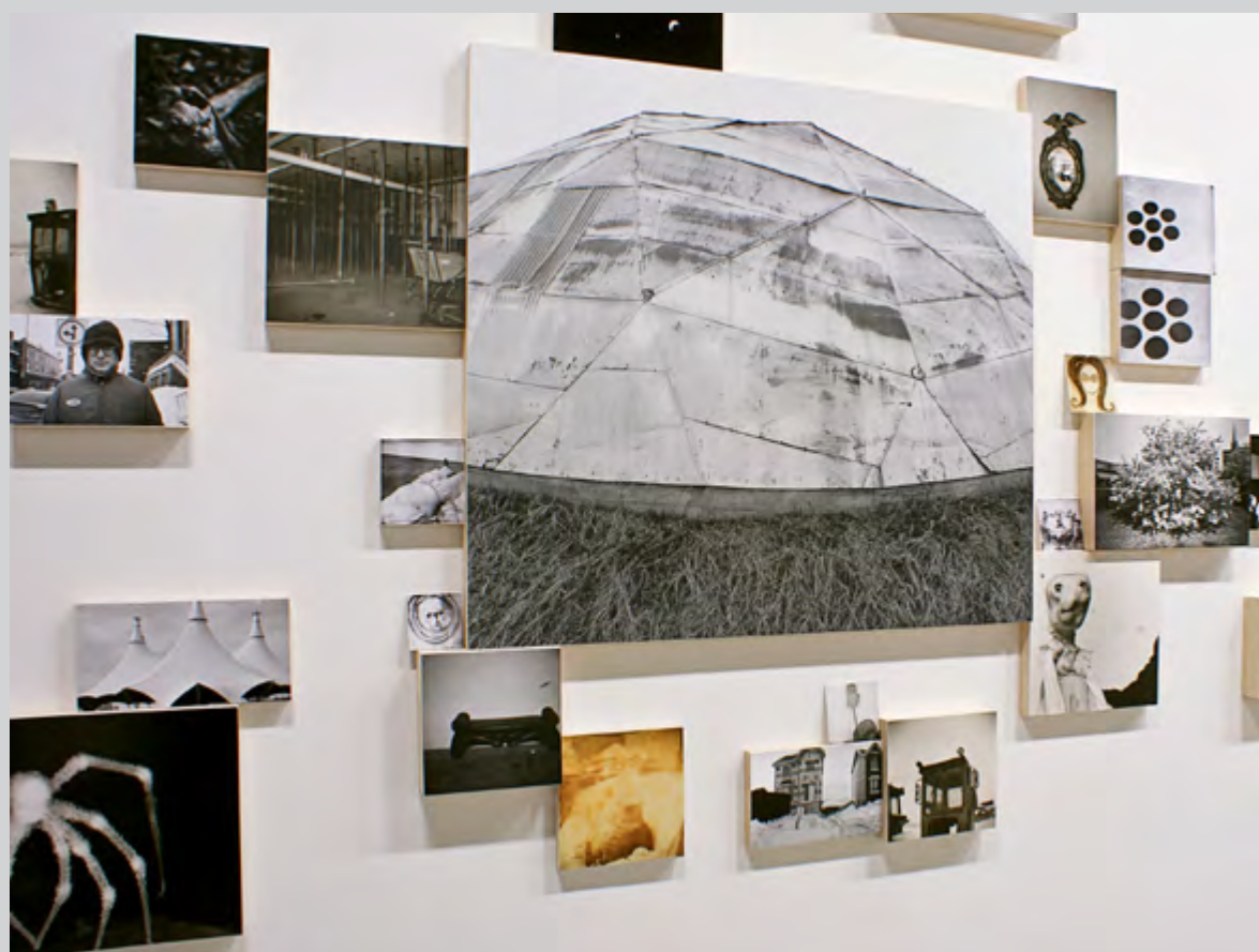
Vues d'exposition de Visites libres , 2013, épreuves argentiques et tirages au jet d'encre