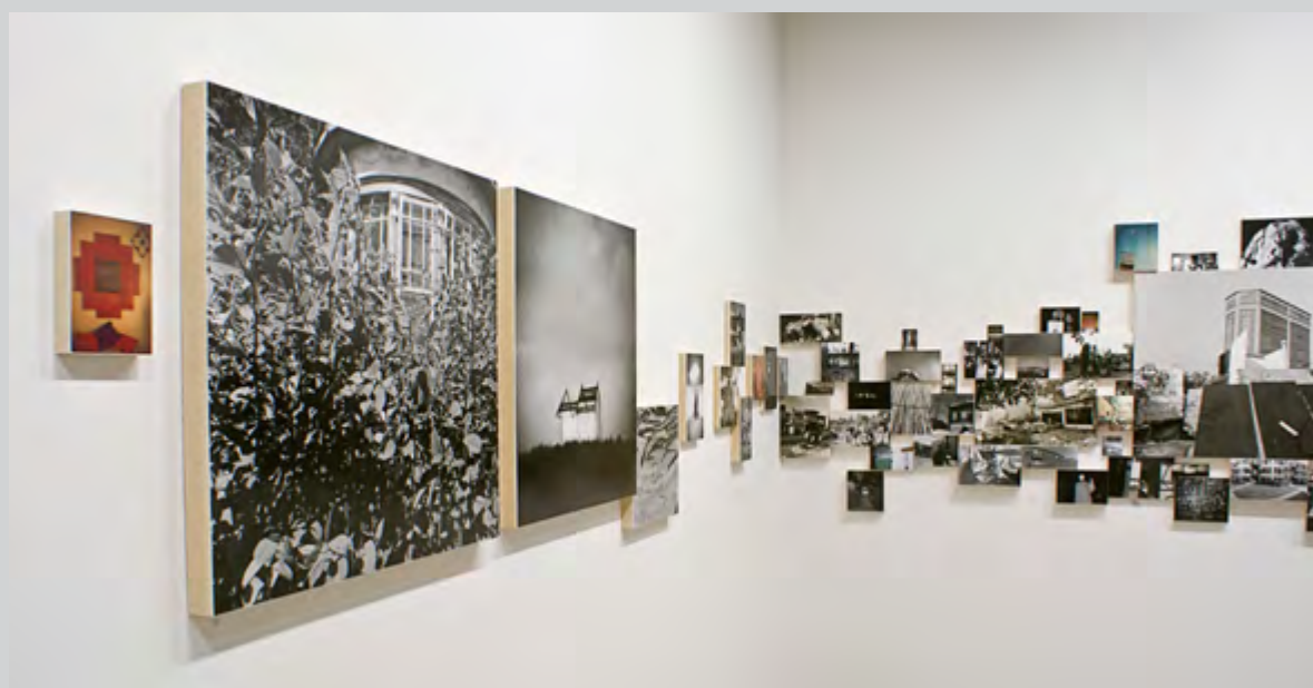
Vue d'exposition de Visites libres , 2013, épreuves argentiques et tirages au jet d'encre

Visites libres présente le (les ?) regard(s) que pose Yan Giguère sur la notion d'habitat. Sur ses significations, ses implications, ses occupants, que ceux-ci soient