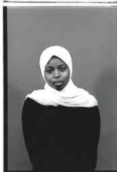
De la série / from the series Portraits dénudés, Identités métropolitaines 02 , 1990-1991, 70 x 50 cm ; 01 ; 02, 1998-1999, photographie argentique / gelatin silver photograph, 50 x 70 cm