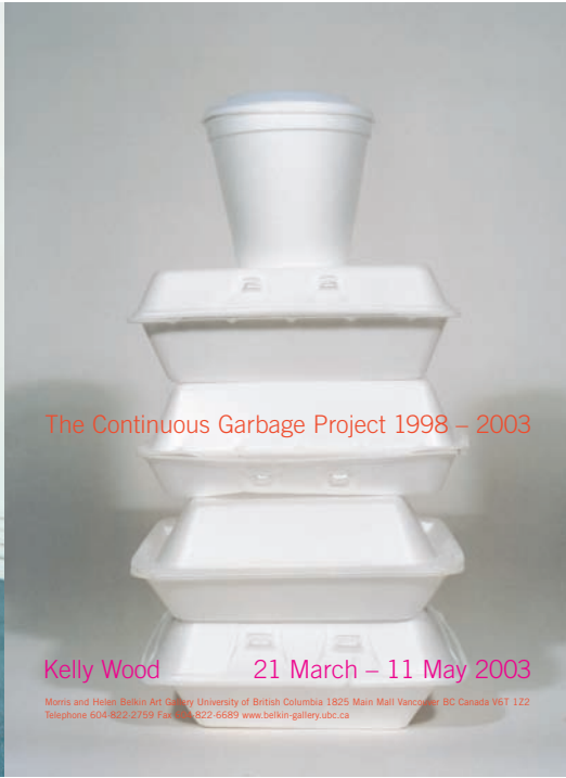
The Continuous Garbage Project 1998 – 2003