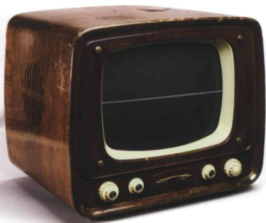
Nam June Paik Zen for TV 1963, 1976 version Manipulated vintage television and components / Téléviseur ancien modifié et composantes 48.3 x 57.2 x 45.7 CM Courtesy of / permission Smithsonian American Art Museum, gift of Byungseol and Dolores An