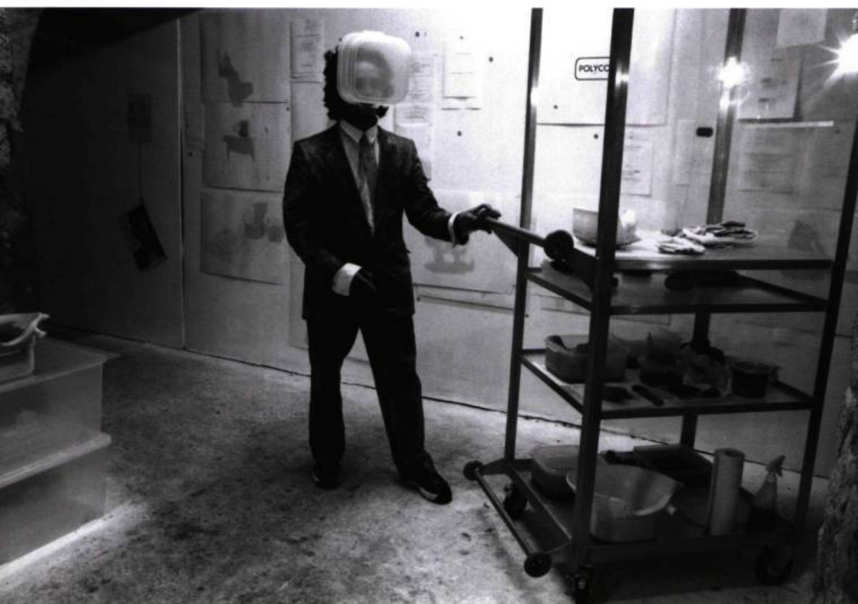
Siège social temporaire II (Polyco) 1998

Que signifie prendre une photo dans un champ de blé d'Inde Celle du gardien du Monument-mou . Humide préposé aux écoulements, qui veille à ce que la monumentalité ne se pétrifie pas définitivement. Peut-être, arriver à capter un fragment de présence, de lucidité, avec des bottes-contenants d'eau et une caméra à trois pattes, en attendant un éclaircissement pour déclencher l'ouverture. À l'horizon sous un ciel variable.