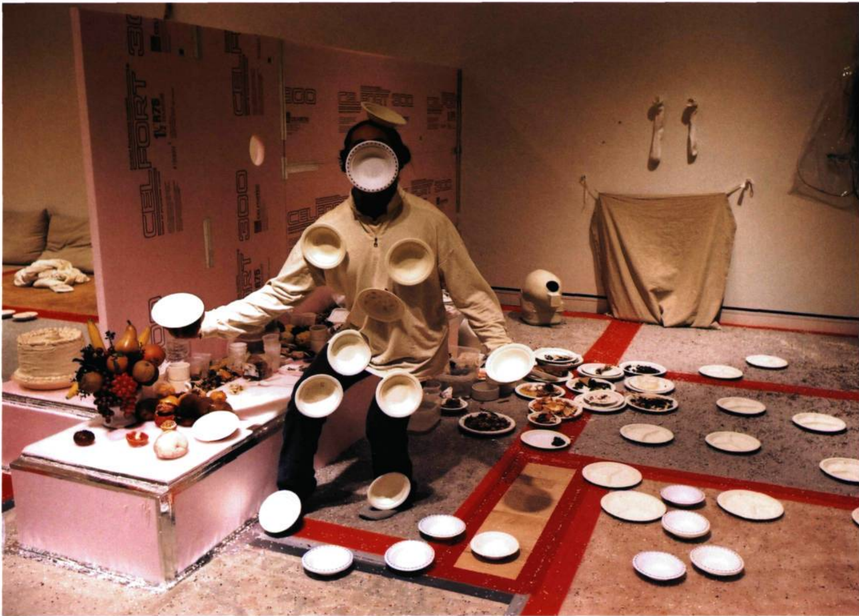
Ici, maintenant. Avec l'impermanence de nos restes (Darboral) 2002

Des vêtements-revêtements se sont tissés, avec leurs thermorégulations émotives. Préposés au papier peint et à la couture nous sommes devenus.