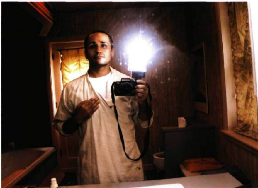
Une réflexion de soi-même (Porus) 2003