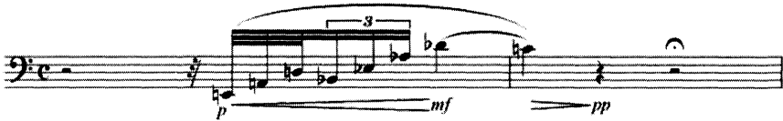
Exemple 4. Quartes tirées du motif G précédant l'accord central (mes. 6, violoncelle)

ce dernier motif rythmique s'enchaînent des valeurs de plus en plus rapides en préparation de l'apex, un procédé typique de Berg pour créer un sentiment d'accélération (ou l'inverse) sans ajouter d'indication de tempo ou sans changer la métrique 18 . Le violoncelle appose la touche finale à cette courbe ascendante en signalant la contribution masculine : un motif de quartes ascendantes (exemple 4) rappelle clairement les quartes du motif G.