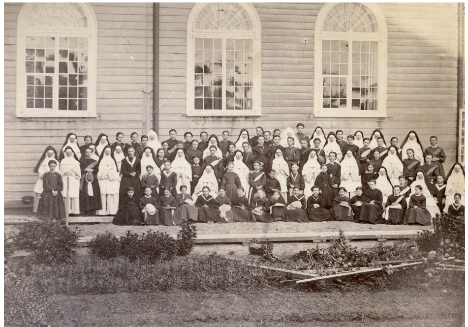
Avant la fermeture du pensionnat en 1867, des élèves et des enseignantes posent fièrement devant le bâtiment de l'ancien chœur des religieuses. Au cours de ses 143 ans d'existence, l'établissement a accueilli 1788 jeunes filles.

Au milieu du XIX e siècle, le pensionnat est bien établi. Les religieuses y enseignent entre autres la grammaire française, l'écriture, l'arithmétique, l'histoire, la géographie et l'anglais. Une dizaine d'entre elles donnent des cours à trois classes d'élèves, une quarantaine répartis selon leur niveau et leur âge. Le coût d'inscription est peu élevé, comme le laisse entendre mère Saint-Anselme dans une lettre adressée à l'archevêché, en 1850 : « Toutes sont considérées être instruites gratuitement, car le prix qu'on exige ne paie que la pension [et] le chauffage. » L'horaire journalier est réglé de façon rigoureuse. La journée débute à 5 h 15 et se termine à 20 h 30 pour les plus vieilles. Les cours se donnent du lundi au samedi et sont entrecoupés de récréations et de séances d'étude.