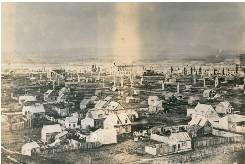
À la suite de l'incendie du 14 octobre 1866, un paysage dévasté borde le monastère qui a servi de refuge aux sinistrés.

Le 14 octobre 1866, un incendie majeur rase la presque totalité des faubourgs Saint-Roch et Saint-Sauveur. Pour la population avoisinante, le monastère, encerclé par le brasier, devient un lieu de refuge.