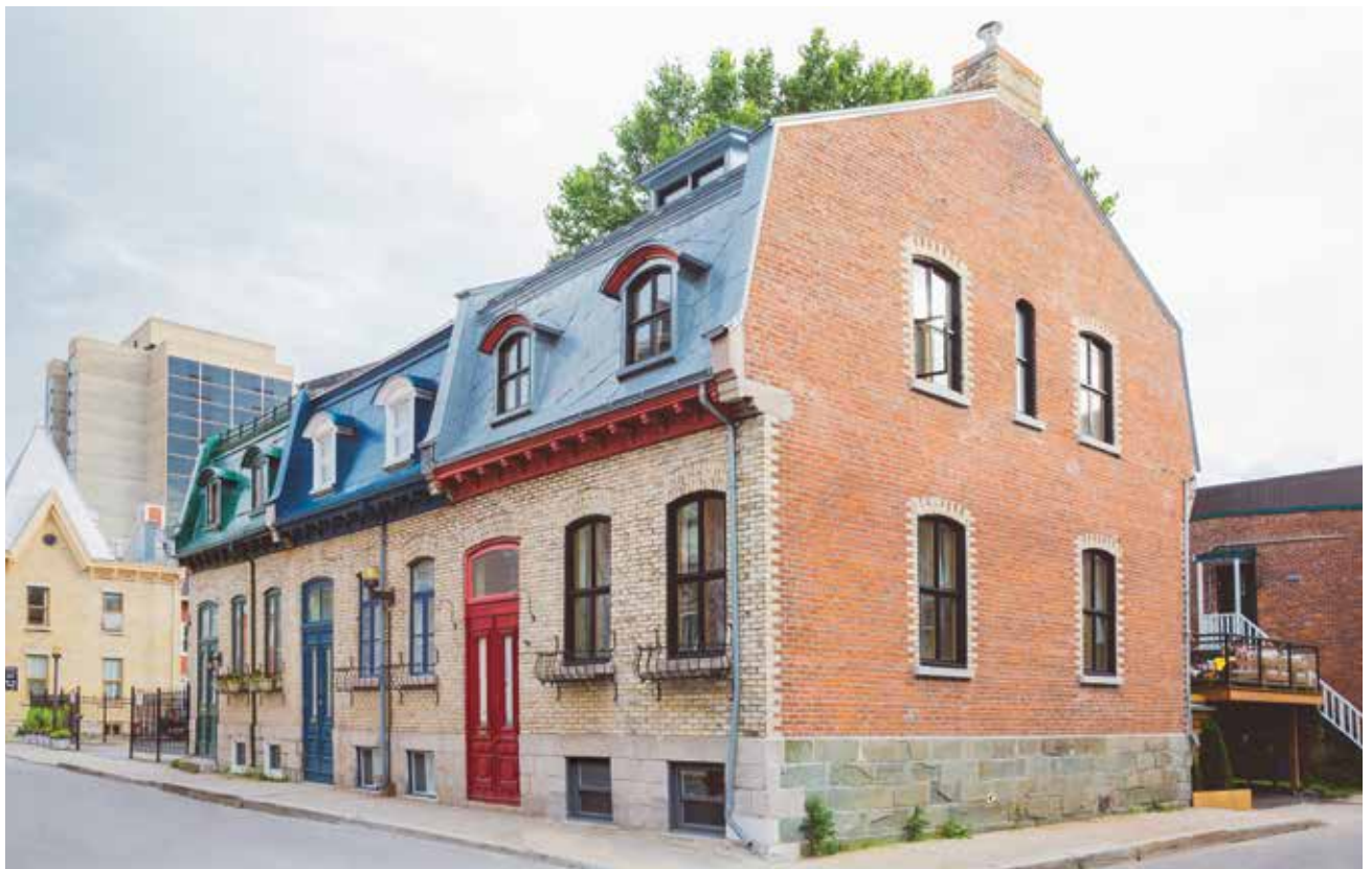
Tergos Architecture + Construction a agrandi cette maison en rangée du quartier Saint-Roch, à Québec, avec des matériaux nobles, durables et vernaculaires. Les fenêtres sont efficaces et respectent l'authenticité de la demeure.