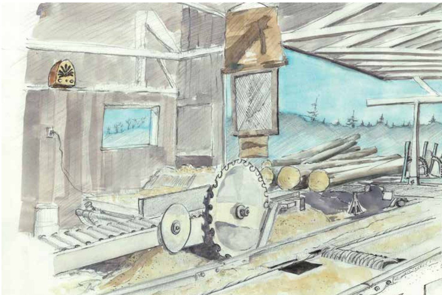
La scie ronde possède des dents renforcées de chrome. Afin qu'elle ne se coince pas, une rondelle de métal assure un écartement constant entre la planche découpée et la scie. Au-dessus, un rideau de broche et de jute protège l'opérateur des éclats de bois.