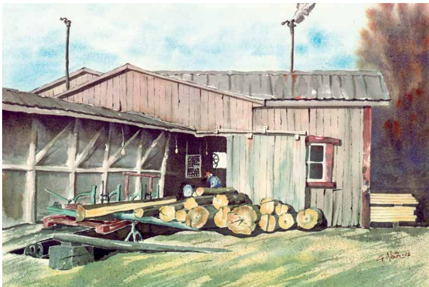
L'un après l'autre, les billots empilés à l'extérieur sont arrimés solidement au chariot qui se déplace vers la scie ronde.

le développement des meuneries industrielles, au tournant du XX e siècle, a mis fin à la production de la farine.