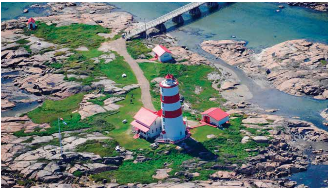
Les anciens gardiens du phare de Pointe-des-Monts, sur la Côte-Nord, ont mobilisé la population locale pour convaincre le gouvernement du Québec de préserver le bâtiment.