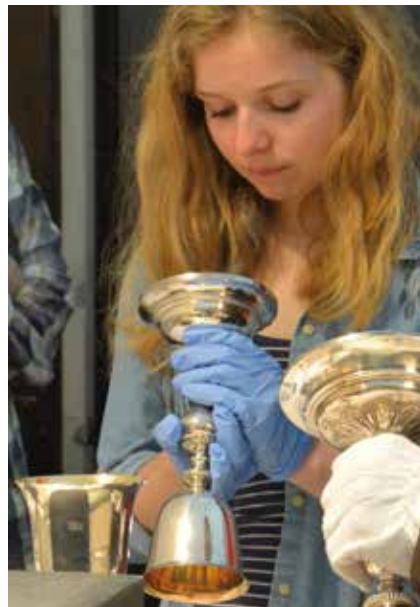
Une étudiante travaille ici à l'inventaire des objets liturgiques de la cathédrale.