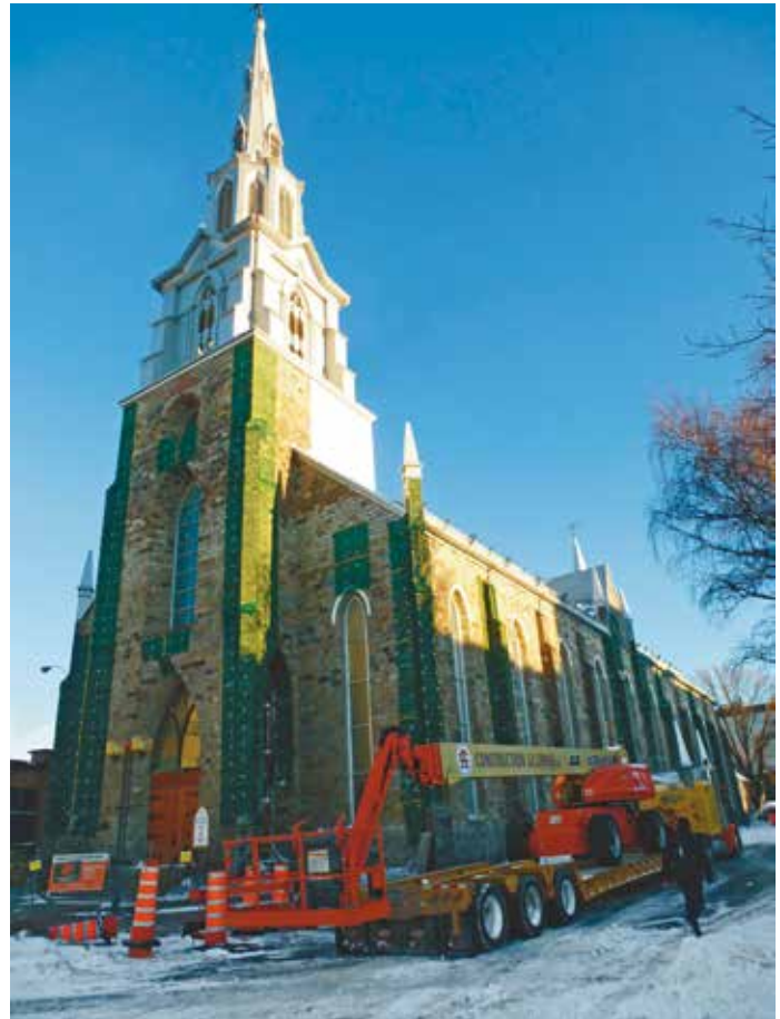
En 2014, on a érigé un périmètre de sécurité autour de la cathédrale et posé des filets de rétention sur le bâtiment.

En mai 2015, le LAP partage ses résultats préliminaires avec la communauté au cours d'une journée intitulée «La cathédrale de Rimouski dans tous ses états», tenue dans le cadre du Congrès de l'Association francophone pour le savoir (Acfas) à Rimouski. La salle paroissiale qui occupe l'ancienne sacristie, rouverte au public pour l'occasion, abrite une exposition sur l'histoire humaine et matérielle de la cathédrale Saint-Germain. Des documents iconographiques et des objets, pour la plupart inédits, mettent en scène ses bâtisseurs, son architecture et son décor, ses instruments liturgiques, sa musique sacrée et ses œuvres d'art; d'autres font