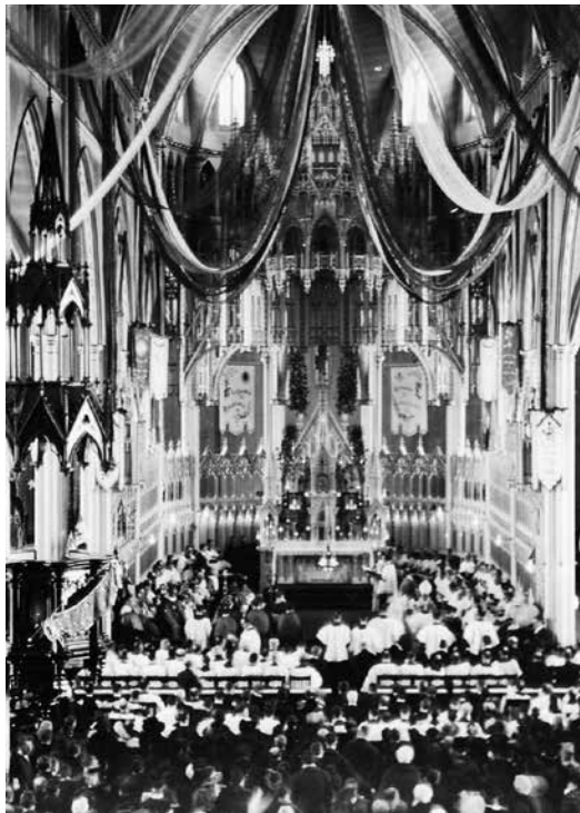
Intérieur de la cathédrale en 1920 (en bas) et en 2015, soit avant et après le retrait de son décor