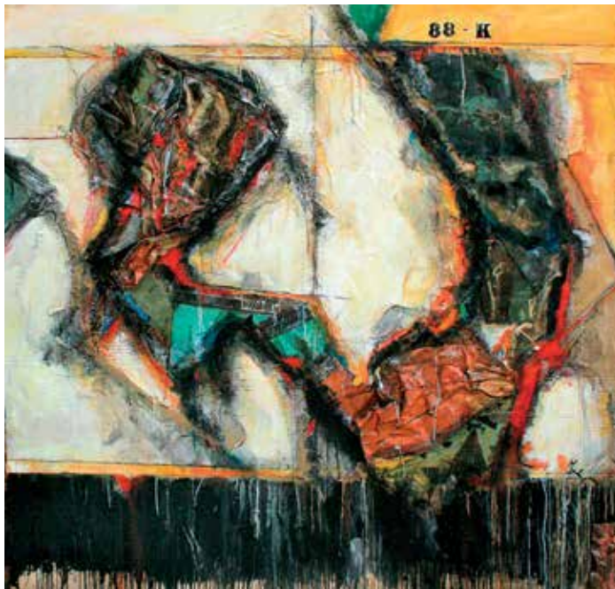
Instant cuivré, n° 88-K de Jean Gaudreau intègre un morceau de l'ancien toit de cuivre du Château Frontenac.