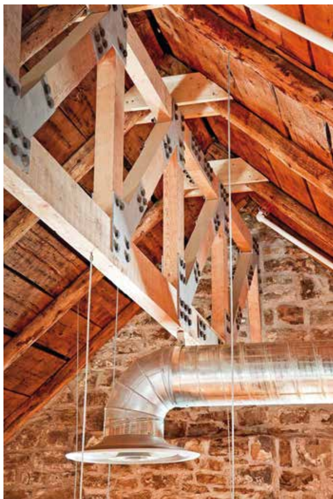
Pour la partie historique, on a tenu compte des façons de faire de l'époque, notamment pour le rejointoiment des murs de pierres. Comme il était impossible de faire passer des conduits et des tuyaux dans les planchers et les murs, on a opté pour des appareils d'éclairage et de ventilation apparents aux lignes épurées.

normes et d'agrandissement s'imposent. Il faut préserver ce bâtiment patrimonial, assurer la sécurité de ses usagers et optimiser son efficacité énergétique. On doit aussi aménager des bureaux fermés pour les équipes d'animation et d'entretien du parc, une salle de réunion, une aire de travail commune, une cuisinette, un espace de rangement et d'archivage, une salle de toilette et une conciergerie. Tout cela avec un budget de 1,3 million de dollars et dans un espace de 296 m 2 !