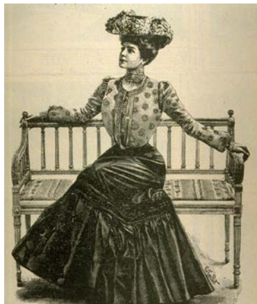
Ill. : Toilette pour jeune femme, L'album universel , vol. 19, n° 11

voir les couleurs et les textures en vogue ainsi que des documents iconographiques qui mettent l'ensemble en perspective.