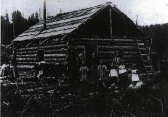
Cette maison des débuts de la colonisation a été construite en 1917 dans le 7 e Rang à Saint-Marc-du-Lac-Long.