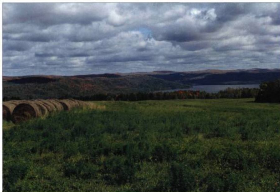
Le Témiscouata offre des vues apaisantes sur une nature souveraine.