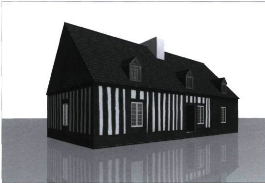
Maquette numérique interactive de la Maison Lamontagne.

Ill. : Nicolas Lévesque Tremblay et Ashraf Mohamed Hamed, École d'architecture, Université Laval