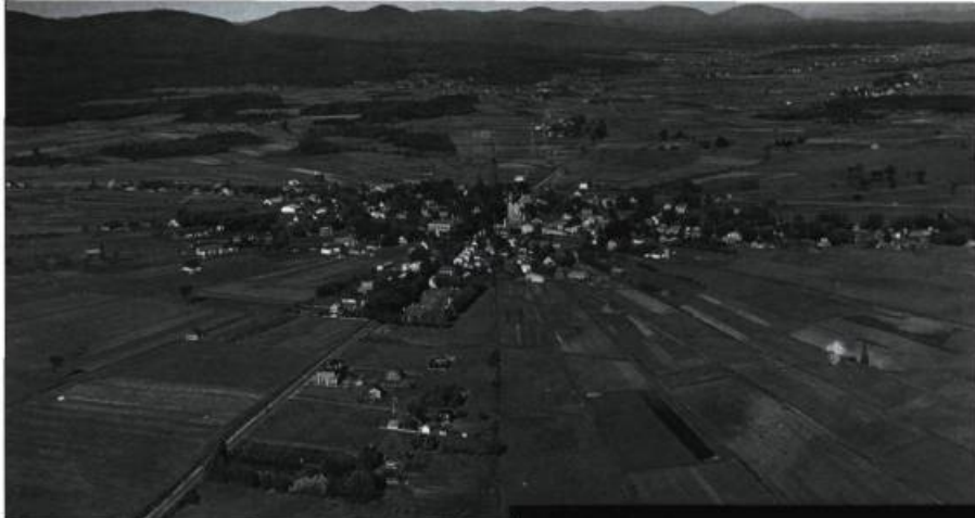
Vue aérienne du Trait-Carré de Charlesbourg en 1937.

Après cinq années de travaux, les 39 églises publiques de Québec (ancienne ville) sont modélisées. En cours de route, le manque de plans pour certaines églises est apparu, ce qui a mené des étudiants de l'École d'architecture de la Faculté d'aménagement, d'architecture et des arts visuels de l'Université Laval à réaliser des relevés sous la supervision de professeurs de l'École dans le cadre d'ateliers de recyclage et de réhabilitation. Un site Web des églises de Québec est enfin créé ( http://limableu.arc.ulaval.ca/eglises/ ); il présente toutes les églises modélisées sous forme d'images de synthèse et de panoramas accompagnés de textes descriptifs fouillés. Ces textes sont tirés de l'ouvrage Art et architecture des églises à Québec de Luc Noppen et Lucie K. Morisset. À l'été 2003, avec la création de la nouvelle ville de Québec, les travaux de modélisation reprennent avec l'ajout de cinq églises, dont Saint-Charles-Borromée, en collaboration avec la Ville de Québec et le ministère de la Culture et des Communications du Québec.