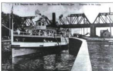
En 1843, la construction du premier canal de Sainte-Anne-de-Bellevue marque un point tournant dans la vitalité commerciale de tout l'Outaouais. Sur cette photographie datant de 1924, on aperçoit le vapeur S.S. Empress qui traverse le canal de Sainte-Anne-de-Bellevue.

En plus de servir au commerce du bois, la rivière des Outaouais voit se développer une autre activité économique importante : l'hydroélectricité. De 1960 à 1963, Hydro-Québec construit un important barrage à Carillon. Cette installation hausse le niveau de l'eau et permet à la navigation de contourner le canal de Grenville. Jumelée au barrage de Carillon, une impressionnante écluse moderne permet de franchir la même dénivellation que l'ancien système de canalisation. Le