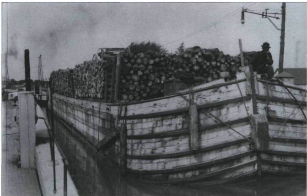
En 1911, éclusage au canal de Chambly d'une barge de 115 cordes de bois de pulpe.