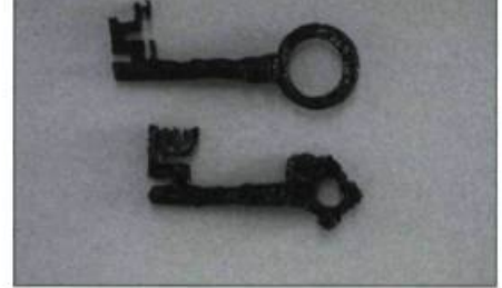
Ces clefs datant du milieu du XVI e siècle témoignent des premiers contacts des Amérindiens avec les pêcheurs européens vers 1500-1570.