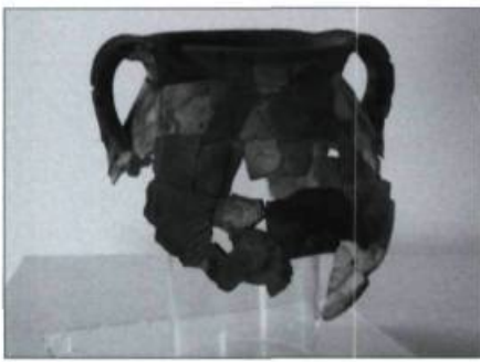
Le troc entre Amérindiens et Européens a laissé des traces enfouies dans le sol, telle cette marmite en terre cuite grossière.