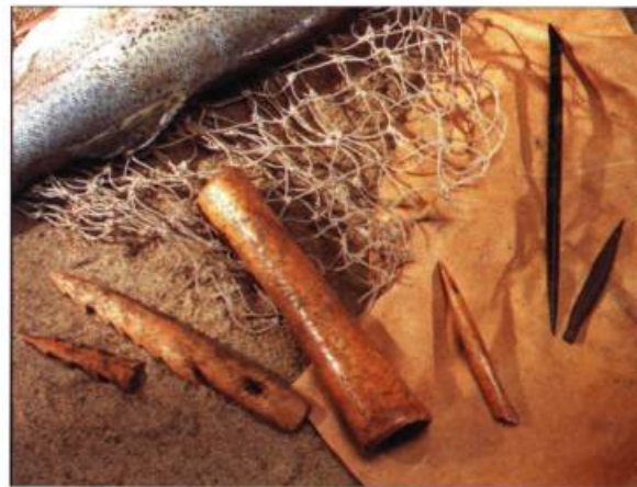
Les groupes iroquoiens de la région de Saint-Anicet utilisaient les os de diverses espèces de mammifères, dont le chevreuil et l'ours, pour fabriquer les outils servant à la chasse et à la pêche. Ceux-ci proviennent du site Droulers.