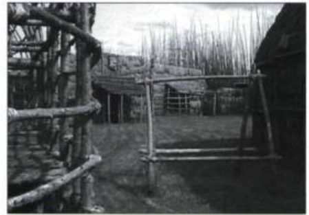
Les maisons longues étaient l'habitation type de ces groupes d'Amérindiens. Généralement, les villages étaient ceinturés d'une palissade qui protégeait des envahisseurs et des intempéries.