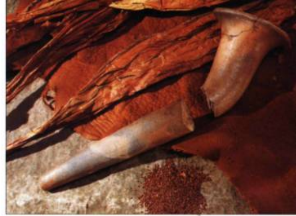
Les pipes en argile et le tabac retrouvés sur le site Droulers témoignent de l'importance de fumer pour les Iroquoiens. Une action qui revêtait un caractère religieux.