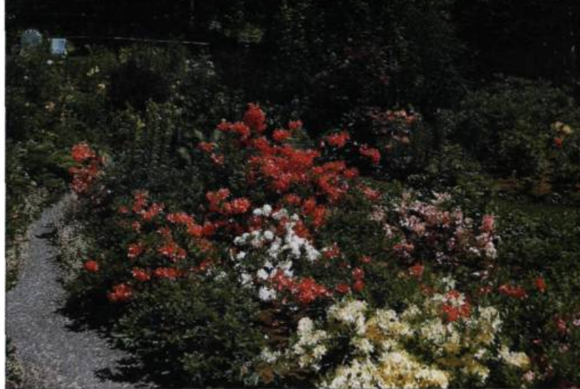
Aux Jardins de Métis, les visiteurs peuvent encore admirer des azalées plantées par Elsie Reford à la fin des années 1920.

De nombreux rhododendrons et des azalées adaptés à notre climat sont issus de croisements effectués avant 1900, principalement en Europe. C'est le cas de plusieurs hybrides de rhododendrons issus de Rhododendron catawbiense , une espèce