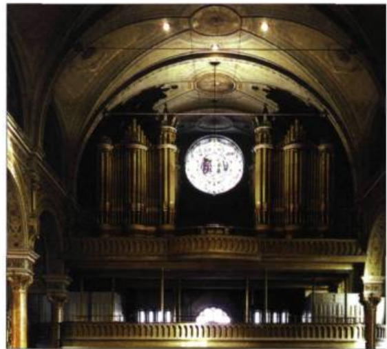
Objet d'une grande fierté locale, l'orgue Casavant de l'église du Très-Saint-Nom-de-Jésus a été restauré grâce à l'expertise de Casavant Frères et à l'implication de la population du quartier Hochelaga-Maisonneuve.