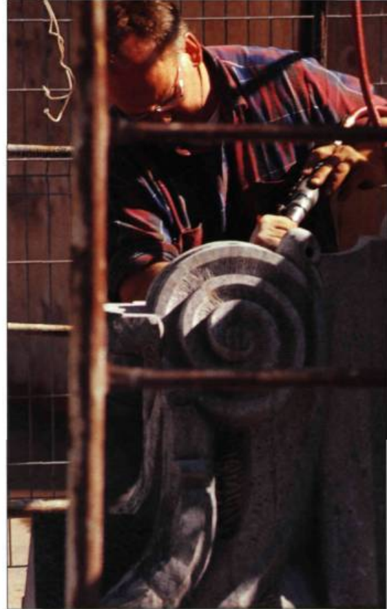
Plusieurs métiers traditionnels, dont la taille de la pierre, sont maintenant rares au Québec.