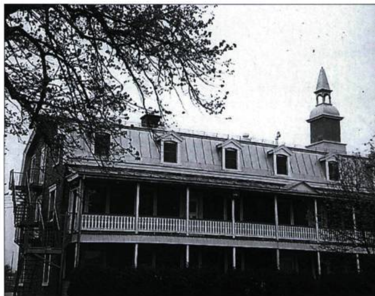
Le couvent Saint-Isidore

de Continuité ). Cette action du Conseil s'ajoute à la longue liste de ses interventions dans ce dossier qui traîne depuis maintenant presque un an. On se rappellera que dès le mois de juillet 1995, le Conseil, de pair avec Héritage-Montréal, avait demandé officiellement au ministre de la Culture et des Communications de classer le couvent comme monument historique. Ce n'est que tout récemment que le Ministère a fait connaître son refus d'accéder à la demande du CMSQ. Bien que le Conseil ainsi que l'ensemble des intervenants