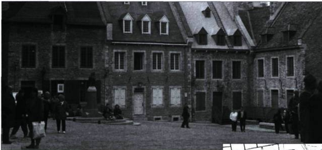
La restauration de l'îlot quatre de Place-Royale doit préserver les valeurs d'un tissu bâti ancien. Sur sa face sud, l'îlot est délimité par la rue Notre-Dame.