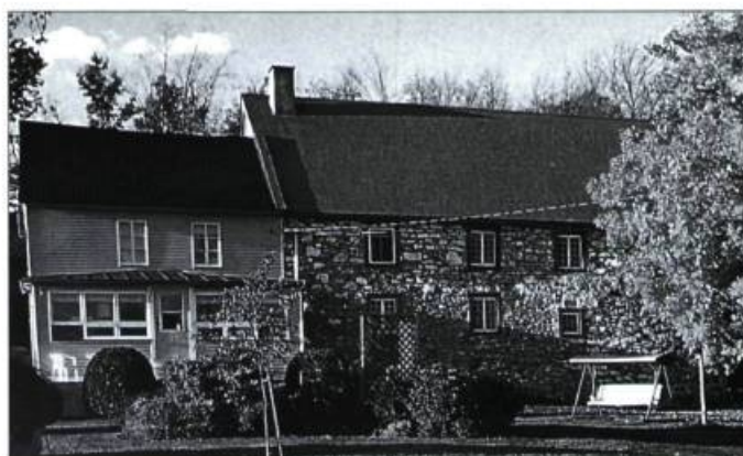
Tombant en ruines il y a quelques années, le moulin du « p'tit canton », âgé de 250 ans, est aujourd'hui objet de fierté.

En octobre 1995, après 5 chantiers, 5 mois de travail, 55 bénévoles et 17 000 $ de matériaux, le moulin est méconnaissable. Les quatre murs de pierre ont été littéralement reconstruits, le toit est remplacé et de nouvelles lucarnes sont percées. Un escalier de pierre neuf permet d'atteindre un belvédère d'où on