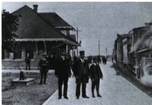
La gare de l'Intercolonial à la fin du siècle dernier.