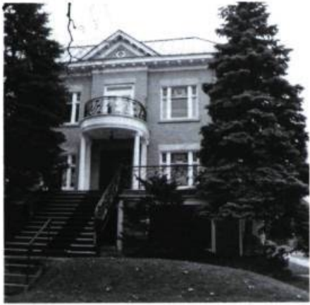
Maison F. Guérin, 26, Ainslie (Z. Trudel, arch.; 1912).