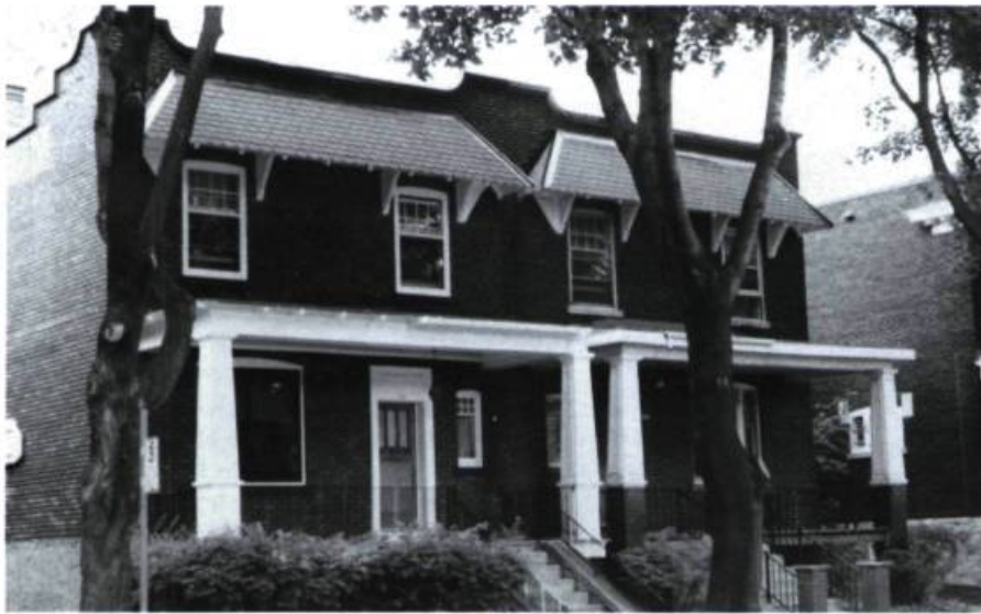
Jumelé, 776-778, Hartland (1925).

Plus intéressants que les éventuels procédés déloyaux entre collègues ou les façons de rentabiliser son travail en l'appropriant de diverses manières, on retiendra l'habileté qu'il y a à reprendre une formule heureuse sans tomber dans l'exacte et monotone répétition, et l'harmonie qui en a résulté pour la ville, où nombre de bâtiments sont apparentés par le rythme de leur composition sinon par la similitude de leurs formes. Dispersés sur le territoire, ils renvoient les uns aux autres sans que l'on s'en rende compte et créent une familiarité qui n'est pas étrangère au bien-être.