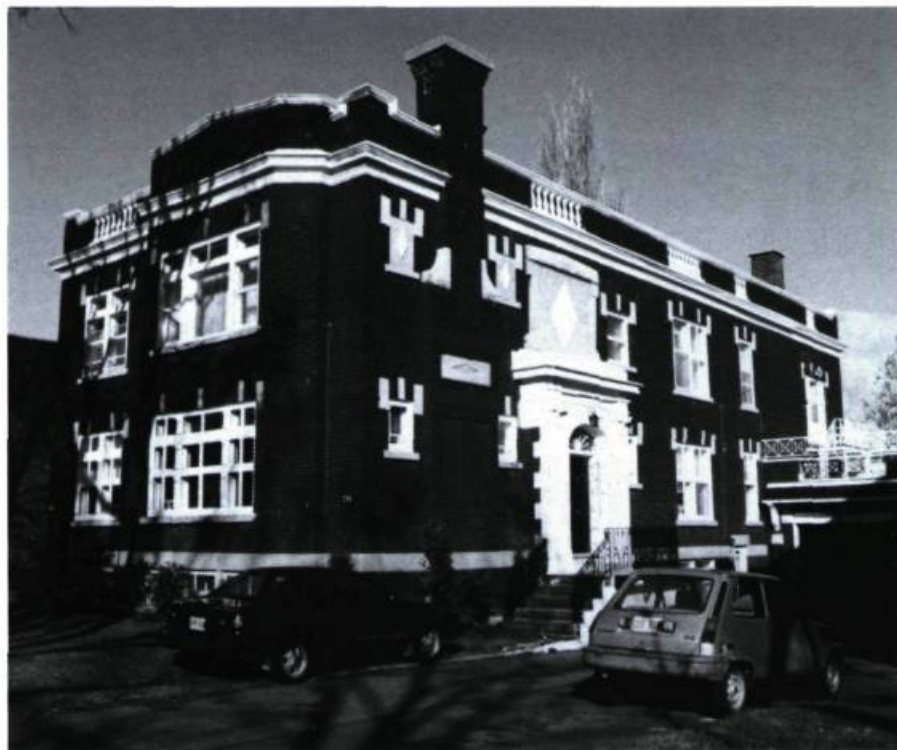
Maisons Beauregard et Labelle, 735-737, Davaar (R. Gariépy, arch.; 1922).

628-630 témoigne d'une intéressante recherche d'unité transcendant leur dualité fondamentale, au niveau de la continuité des fines galeries ioniques, du bandeau de pierre et de la frise de brique qui les surmontent (maisons Laurent & Frère; S. Frappier, arch.; 1913). Dans un autre esprit qui rappelle certains quartiers de Londres, celles qui vont du 580 au 592 (maisons J. Ducharme; L. Parent, arch.; 1926) illustrent un parti autrement inusité à Outremont qui est de reconnaître les garages comme parties intégrantes de l'habitation moderne et de les présenter de plain-pied en façade. La noble corniche qui surmonte encore le garage du 592 et les belles portes dont le 580 donne toujours le modèle révèlent la distinction originelle de l'ensemble.