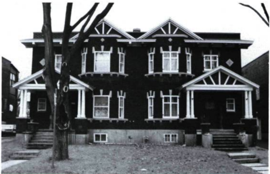
Maisons J. E. Wilder, 866-870, Hartland (J.-H. Noël, dessinateur; 1924).