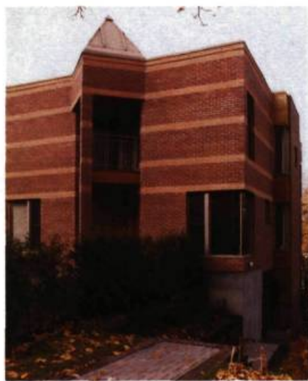
Maison J.-M. Dumas, 1159, Mont-Royal (J. Béique et Ass., arch.; 1986).

présenter des façades aussi équilibrées sur les deux rues. Au nombre des réalisations plus récentes, on ne peut pas manquer la résidence du D r J.-M. Dumas (n° 1159; J. Béique & Associés, arch.; 1986) à la chaude coloration et à l'ingénieuse articulation qui tire profit d'un site en profondeur, ni celle que les architectes Dobro et Milena Miljevic ont construite en 1977 dans un vocabulaire résolument moderne (n° 1167; 1977) mais discret tant par les dimensions de la résidence que par son implantation en retrait.