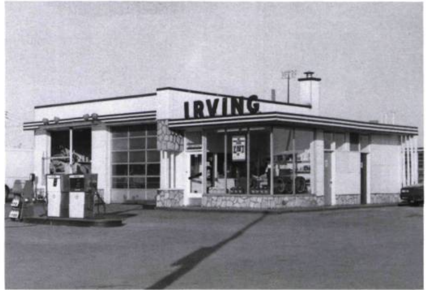
À Montréal, une des rares stations-service qui subsiste des années cinquante.

Le modernisme architectural, qui exploite les nouveaux matériaux ainsi que les techniques industrielles et qui se caractérise par des formes géométriques, privées de décor et définies par la fonction qu'elles renferment, s'est manifesté timidement entre 1935 et 1945. Après la guerre cependant, il ne tarde pas à s'imposer partout. Cette architecture, que ses auteurs veulent résolument différente de celles qui l'ont précédée, profite alors d'une conjoncture favorable. La reprise économique contribue à l'enrichissement général. L'automobile, objet d'idolâtrie, se trouve désormais à la portée d'un grand nombre. Elle facilite les déplacements et développe le goût de voyager. Elle aura d'ailleurs un effet décisif sur l'aspect des nouveaux quartiers à la périphérie des villes. Par surcroît, le coût relativement bas des terrains hors des villes exerce une forte attraction et concourt, à sa manière, à façonner l'image de la banlieue.