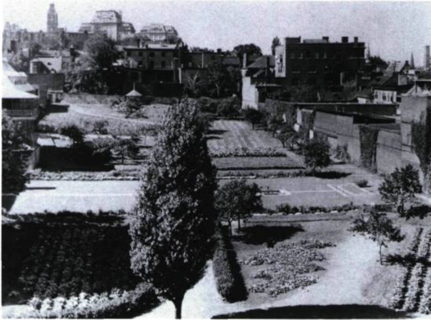
Le jardin du monastère des Ursulines en 1939.