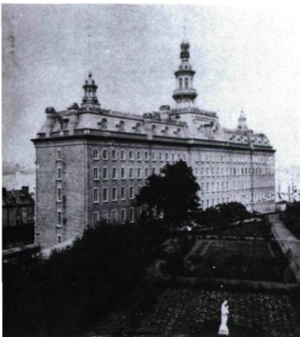
Une partie du jardin du Séminaire de Québec vers 1875.