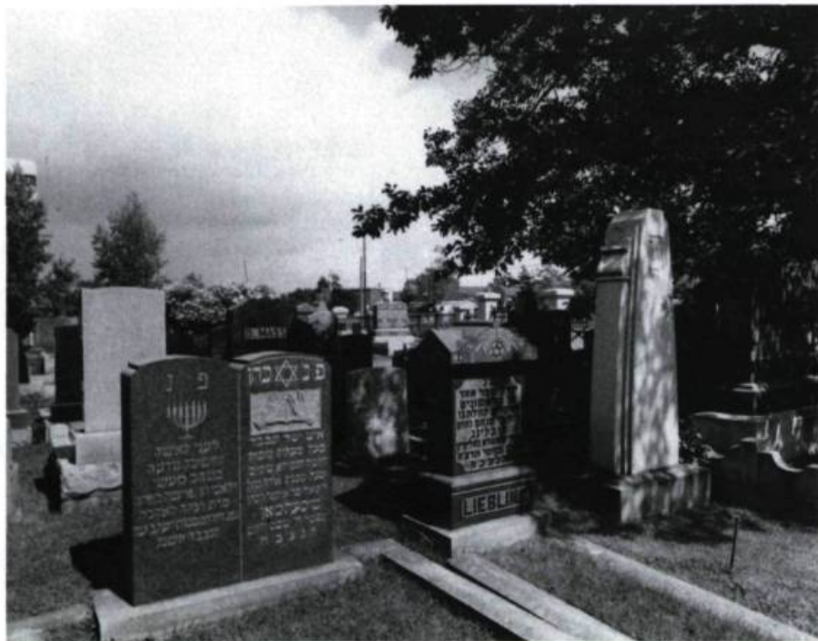
Le cimetière juif de Québec est à Sainte-Foy, en bordure du boulevard Saint-Cyrille. Ses origines remontent de façon certaine à 1879.