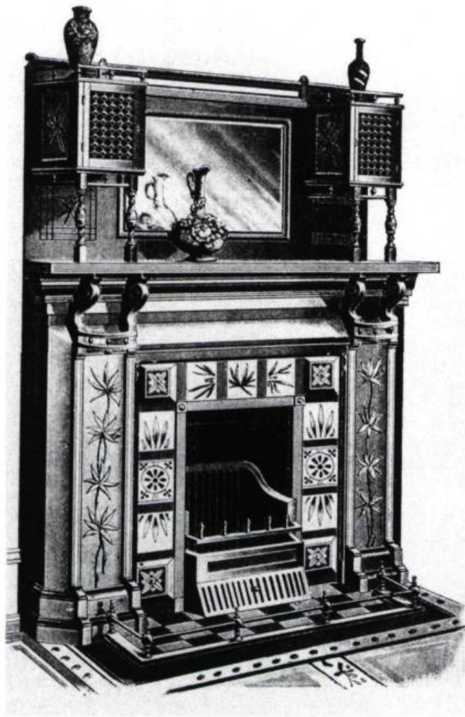
Foyer et manteau ouvragé du tournant du siècle.

L'authenticité. Quel que soit l'âge de votre foyer ou l'époque de sa construction, cherchez à lui conserver toute son authenticité. Par exemple, un foyer à âtre converti en foyer au charbon de bois à l'époque victorienne (XIX e siècle) possède un grand intérêt; gardez ces traces de son histoire.