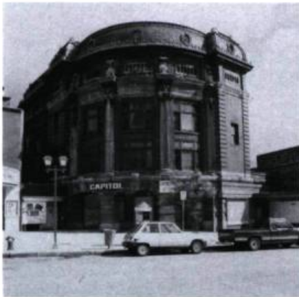
Le Capitol, le dernier des palais de Québec (1903), est en voie de recyclage. On a, depuis, libéré l'édifice des petites annexes qui s'y étaient accolées au fil des ans.