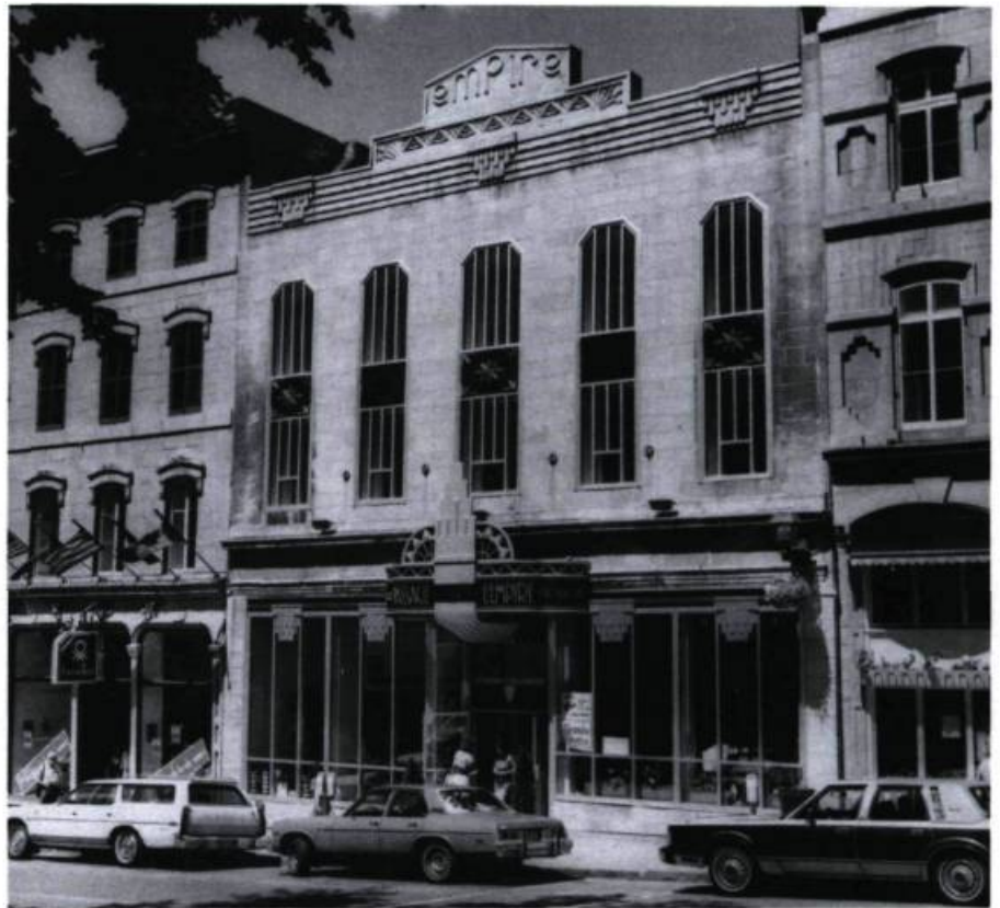
Le cinéma Empire, transformé en galerie marchande en 1987.

Cinéma Cartier (1928, Wilfrid Lacroix et J.C. Drouin arch.), 1019, rue Cartier. Édifice recyclé en 1987, Carrier et Déry arch.