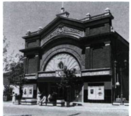
Une réhabilitation réussie: le théâtre Princesse à Rivière-du-Loup.

Ce cinéma porte bien son nom car tout son décor est un hommage des plus hollywoodiens au chaud paysage d'Espagne. Au Granada, le spectacle est autant dans la salle qu'à l'écran. Celle-ci est un rare et parfait exemple des salles dites «atmosphériques» où, en plus du décor exotique, on imitait la voûte céleste en projetant au plafond des nuages en mouvement et des scintillements d'étoiles. Le Granada a fermé ses portes en 1982 et, quoiqu'un peu défraîchi, il subsiste dans toute son intégrité. Le Fonds du patrimoine estrien a déposé en 1986 une fort sérieuse étude de potentiel pour un réaménagement de la salle mais ce projet n'a pas été retenu. L'édifice a toutefois été acquis en 1987 par Gestion Norcadev qui y a effectué des travaux urgents (toiture, chauffage) et qui compte transformer bientôt le théâtre en une salle multifonctionnelle.