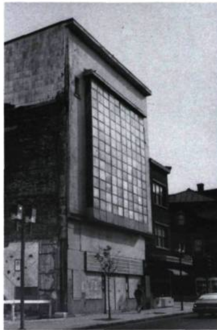
Attention, une façade peut en cacher une autre... C'est le cas de l'ancien cinéma Pigalle (1911), dans la basse ville de Québec.

Cinéma Pigalle (1911, A. Trudel arch.), 261-265, rue Saint-Joseph Est.