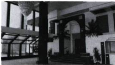
Le nouveau foyer qui donne accès à la salle J.-Antonio Thompson à Trois-Rivières, une intervention sous le signe du respect.

Par son intérieur aux formes épurées, où sont intégrés habilement tous les équipements acoustiques, le petit cinéma Ville-Marie n'avait rien à envier aux salles les plus modernes des grandes villes. L'ornementation intérieure, fort originale, est formée entre autres de frises aux motifs de feuilles d'érable vertes et rouge vin. Cet élément se retrouve en apothéose sur le grand rideau de scène qui est une transposition fidèle d'un modèle de drapeau canadien-français que proposaient à l'époque certaines sociétés Saint-Jean-Baptiste. Le cinéma Ville-Marie, récemment mis en vente, possède un intérieur intact de grand intérêt et mérite certainement une meilleure reconnaissance car sa survie en tant que cinéma n'est pas assurée.