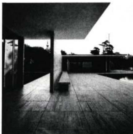
Le Pavillon de Barcelone, de Mies van der Rohe. Vue de l'annexe de service du pavillon principal.

Les bâtiments de ce type sont organisés suivant des principes de composition classique, à l'instar des villas et des palais de la Renaissance. L'immeuble résidentiel parisien ainsi que l'hôtel particulier sont les modèles par excellence de cette typologie.