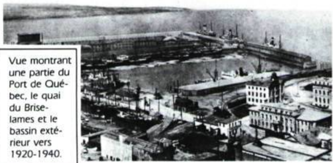
Vue montrant une partie du Port de Québec, le quai du Brise-lames et le bassin extérieur vers 1920-1940.