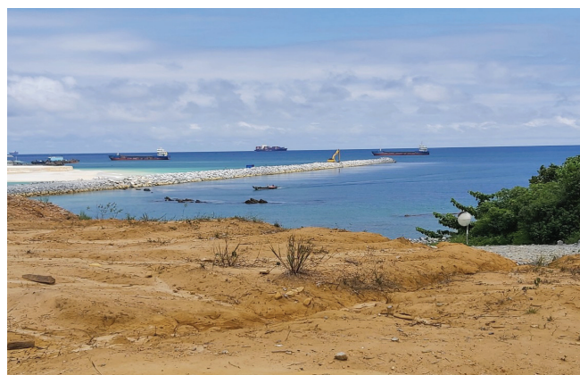
Figure 1. Le port de Kribi au Cameroun en 2021