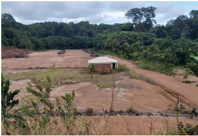
Figure 3. Le site de relocalisation prévu pour Lolabé