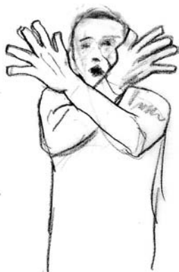
FIGURE 4 Light Music en croquis : geste croisement-effroi