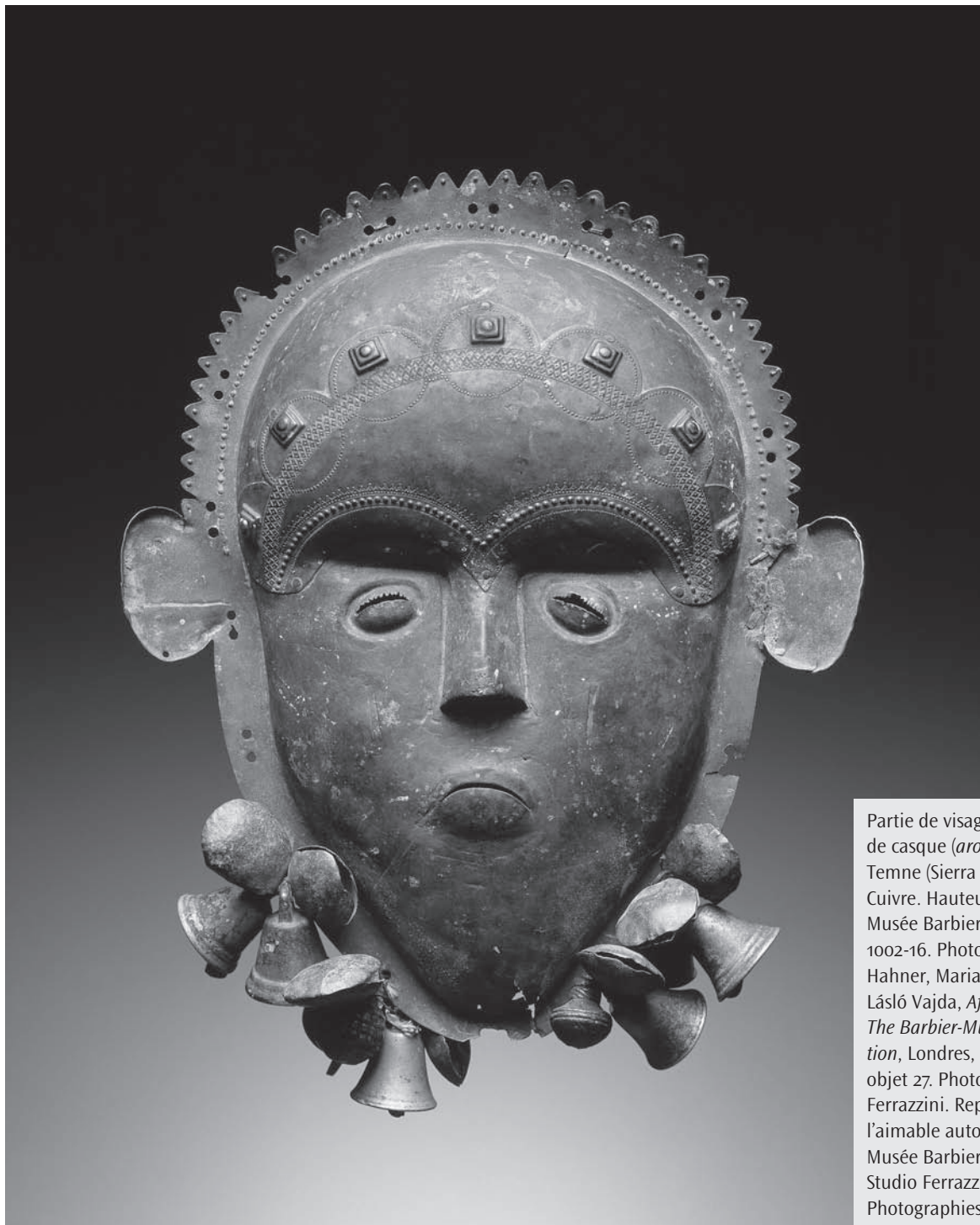
Partie de visage d'un masque de casque ( aron arabai ). Temne (Sierra Leone). Cuivre. Hauteur : 29 cm. Musée Barbier-Mueller, Inv. 1002-16. Photo tirée de Iris Hahner, Maria Kecskési et László Vajda, African Masks: The Barbier-Mueller Collection , Londres, Prestel, 2007, objet 27. Photo : Pierre-Alain Ferrazzini. Reproduite avec l'aimable autorisation du Musée Barbier-Mueller et du Studio Ferrazzini Bouchet Photographies.