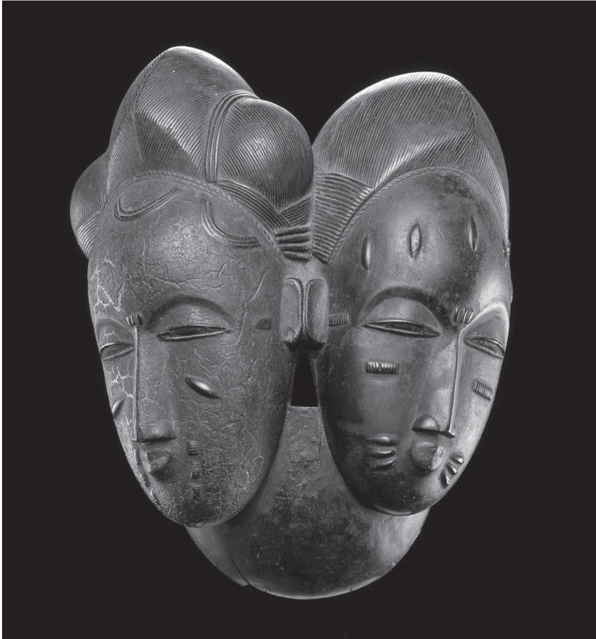
Masque jumelé du groupe Mbolo. Baule (Côte d'Ivoire). Bois peint. Hauteur : 29 cm. Musée Barbier-Mueller, Inv. 1007-65. Musée Barbier-Mueller, Inv. 1004-11; anciennement de la collection de Roger Bédiat. Image tirée de Iris Hahner, Maria Kecskési et László Vajda, African Masks: The Barbier-Mueller Collection , Londres, Prestel, 2007, objet 41.