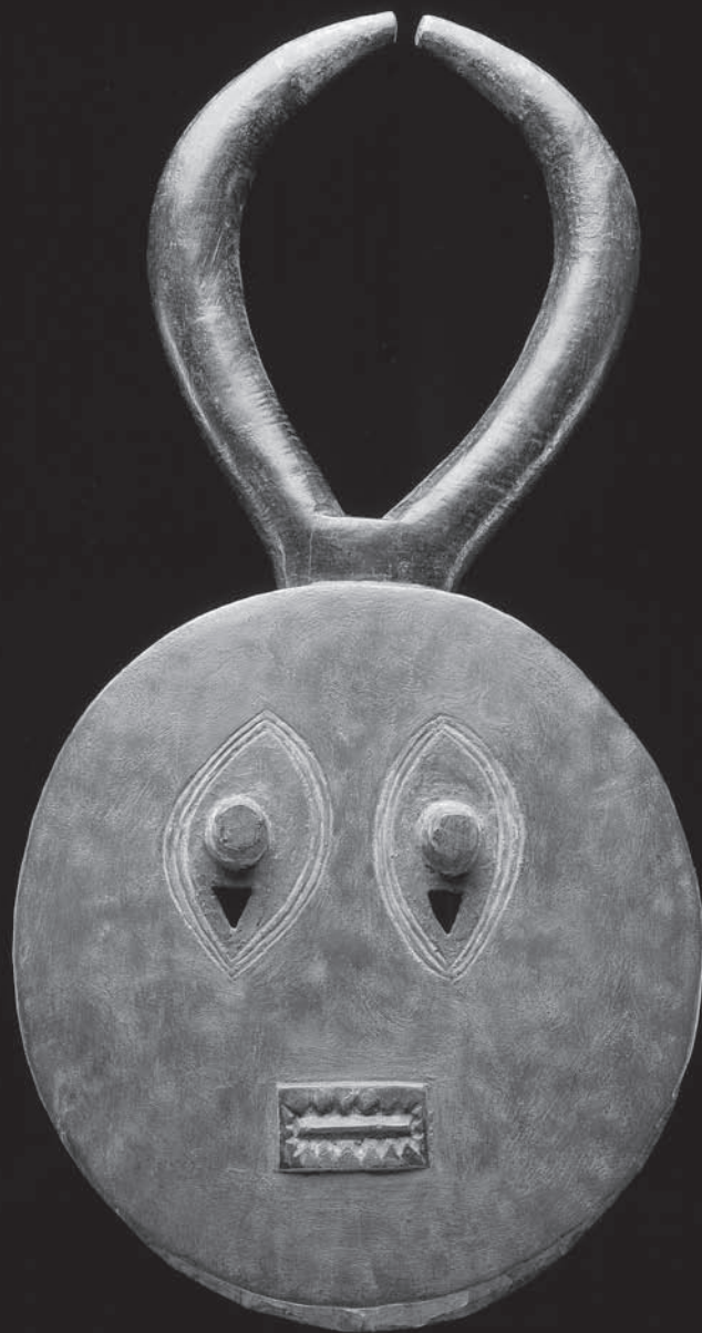
Masque de visage pour femme du groupe Goli ( kplekple bla ). Baule (Côte d'Ivoire). Bois peint. Hauteur : 42 cm. Musée Barbier-Mueller, Inv. 1007-21 ; anciennement de la collection de Charles Ratton. Image tirée de Iris Hahner, Maria Kecskési et László Vajda, African Masks: The Barbier-Mueller Collection , Londres, Prestel, 2007, objet 40. Photo : Pierre-Alain Ferrazzini. Reproduite avec l'aimable autorisation du Musée Barbier-Mueller et du Studio Ferrazzini Bouchet Photographies.