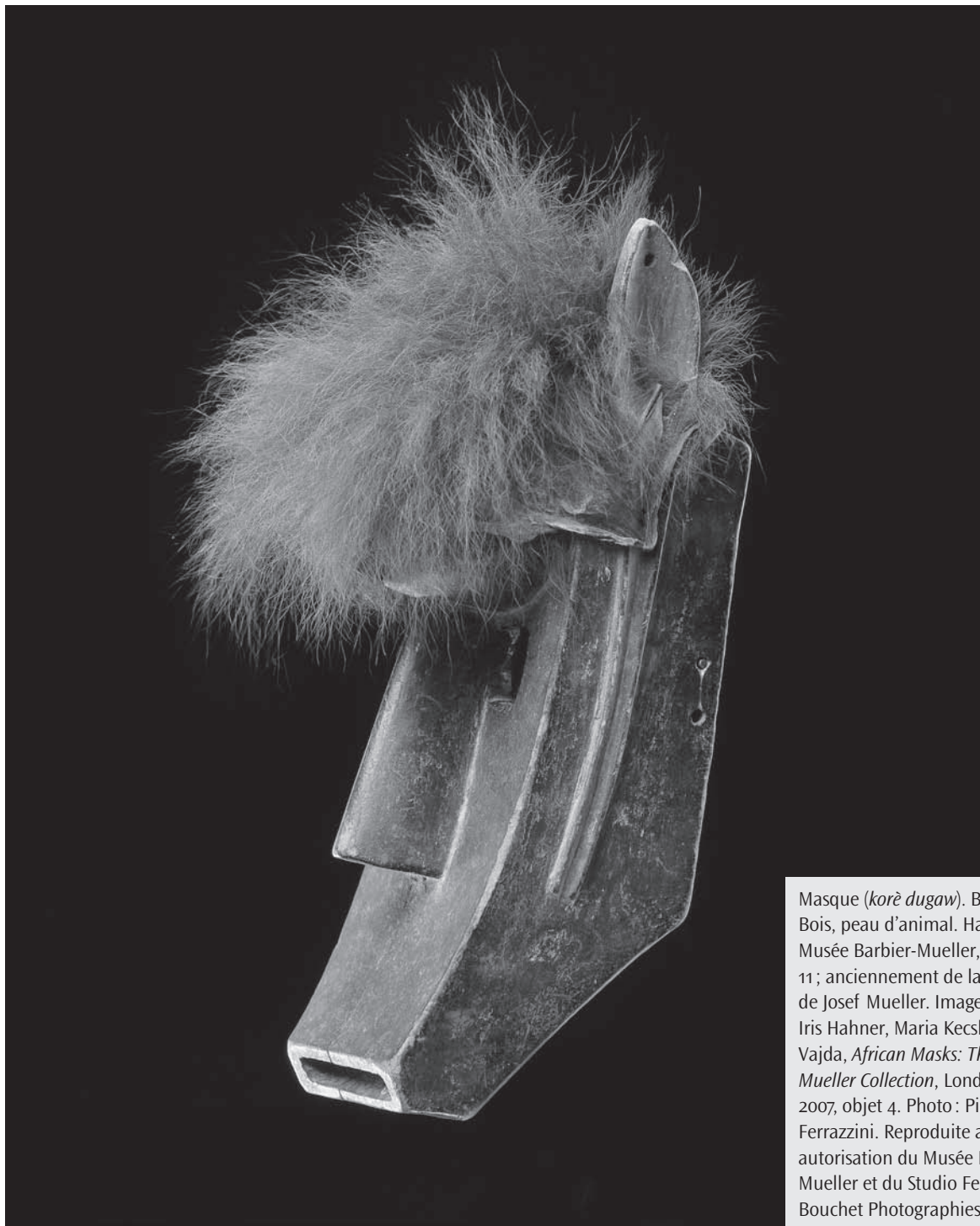
Masque ( korè dugaw ). Bamana (Mali). Bois, peau d'animal. Hauteur : 37 cm. Musée Barbier-Mueller, Inv. 1004-11; anciennement de la collection de Josef Mueller. Image tirée de Iris Hahner, Maria Kecskési et László Vajda, African Masks: The Barbier-Mueller Collection , Londres, Prestel, 2007, objet 4.