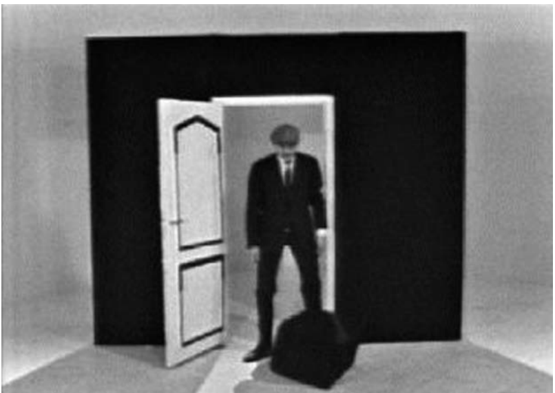
Fig. 5 et 6. Georges Bernier dans le sketch «Un jeu bête et méchant avec le Professeur Choron» de la neuvième émission de la série Les raisins verts (Jean-Christophe Averty, 8 juin 1964).