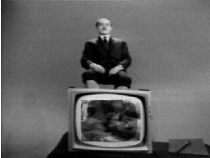
Fig. 7. Georges Bernier dans le sketch « Un jeu bête et méchant avec le Professeur Choron » de la quatrième émission de la série Les raisins verts (Jean-Christophe Averty, 13 janvier 1964).

surréalistes d'un Man Ray ou d'un Joseph Cornell 12 . Cette mise en question de la télévision comme boîtier créatif montre en contrepartie ses formidables ressources. Entre imagination et simulation, on constate que le « jeu bête et méchant » altère la spécificité technologique et révolutionnaire que représente le poste de télévision au début des années 1960 en France, période à partir de laquelle l'objet s'installe de manière progressive mais durable dans les foyers français 13 , suscitant une relation particulière avec la famille, promettant un rendez-vous au quotidien. Avec un impact visuel fort, le duo Averty et Choron chahute le lien personnel, voire affectif, que les téléspectateurs entretiennent avec leur télévision.