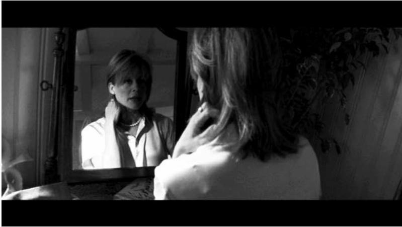
Dante's Peak (Roger Donaldson, 1997).