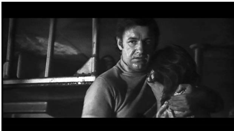
The Poseidon Adventure (Ronald Neame, 1972).

qui conduit l'engin au crash et à l'explosion. Les femmes sont, ici, littéralement désastreuses.