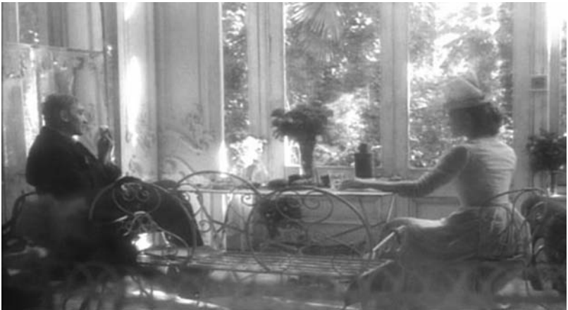
Institut Benjamenta (S. Quay et T. Quay, 1995).

Ce sont en fait deux niveaux de réalité qui travaillent la personnalité et la nature des dirigeants de l'école. Dans une scène singulière qui constitue une sorte d'intermède, Johannes et Lisa vont prendre le thé. Ils se tiennent par le bras et traversent un couloir, baignés dans une lumière vive, l'image surexposée noyant Lisa dans une surface blanche, aveuglante. À ce moment, Johannes marche sans l'aide de sa canne, il la porte certes mais il joue avec, la fait tourner. Il s'agit plus d'un accessoire que d'un prolongement de son corps. Les deux figures se dirigent vers un endroit que l'on ne voit pas, disparaissant dans un des prolongements latéraux du couloir. On les retrouve dans une pièce très lumineuse, assis de part et d'autre d'une table, prenant le thé, devant une immense verrière. La luminosité de la pièce est trop franche pour ne pas fonctionner en contrepoint de toutes les autres scènes où la lumière apparaît seulement par intermittence, balayant l'image d'un voile miroitant qui tout à la fois révèle et aveugle. Johannes lit son journal et Lisa le regarde puis finit par lui avouer sa tristesse de ne plus parler avec lui. C'est une scène d'humanité absolue, où les êtres sont donnés à voir en pleine lumière, une lumière ontophanique qui révèle leur autre nature, l'homme et la femme qu'ils sont