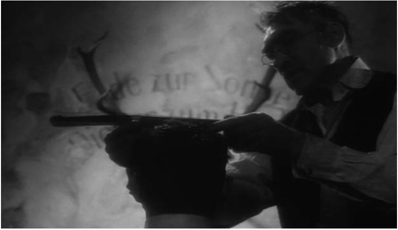
Institut Benjamenta (S. Quay et T. Quay, 1995).

d'emblèmes de la réussite de l'école et de son représentant. Et c'est bien à partir de cette assimilation de l'homme au cerf que l'idée d'animalité du film se développe. Une scène très emblématique de cette transformation symbolique et représentative est celle où Jakob porte des bois par un jeu de superposition des plans de clivage de l'image : Jakob est assis dos à la caméra face au mur. Sur le mur sont peints des bois de cerfs dont on ne voit que les ramures. La position de la tête de Jakob correspond à la base d'où s'élèvent les bois. Bien entendu, il faut être dans notre position de spectateur pour que cet effet soit produit. Pourtant, Johannes qui se trouve soit à côté soit devant Jakob « perçoit » ces bois puisqu'il se met à les mesurer avec un mètre et à en commenter la taille. Le film confond alors espace filmique et espace diégétique, ce que nous voyons de l'espace est également éprouvé par les personnages évoluant dans cet espace. L'illusion fonctionne pour tous et la perception déborde ici les limites du phénomène car l'image de cinéma s'installe dans ce lieu qui est à la charnière de la vision et de l'expérience et nous le donne à voir.