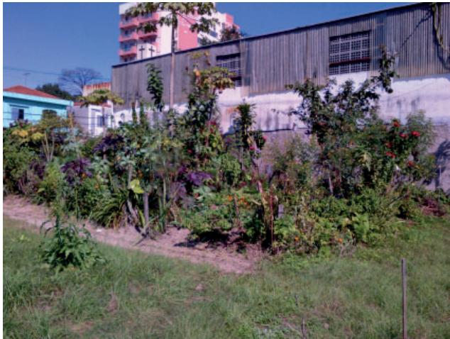
Figure 5 Exemple de jardin agroécologique de style bahianais à São Bernardo do Campo, État de São Paulo.