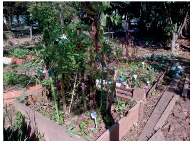
Figure 3 Une vue sur le jardin des chouettes ( Horta das Corujas ), São Paulo

Lors des visites effectuées au Jardin des Chouettes, nous avons constaté une convergence des représentants de ces différentes causes qui en font une vitrine pour exposer leurs différentes revendications éco-socialistes. Selon la co-fondatrice, l'objectif premier du jardin est effectivement la sensibilisation de la population vivant à proximité, mais aussi des enfants d'âge scolaire le côtoyant avec leurs enseignants. Le fait de miser davantage sur l'éducation que sur la production a fait en sorte que ce jardin ne génère pas de revenus et que sa production est souvent offerte gracieusement aux passants et aux jardiniers, moyennant le respect de certaines règles du site. Ce jardin n'est pas le seul de cette catégorie « de visibilité », mais il est assez unique avec son libre accès et son ouverture à tous et toutes. Il attire des curieux venant au parc en balade ou pour y pratiquer des activités ludiques, touchant ainsi un grand nombre de personnes. Les nombreux écriteaux expliquant la démarche des jardiniers urbains, les noms des plantes et les fonctions des différents éléments du site (compostière, prise d'eau naturelle, ruches), invitent au respect des consignes (figure 3). Le jardin n'est bordé que par une fine clôture démarquant les limites du site, frontière poreuse avec le reste du parc, le rendant à la fois invitant et vulnérable.