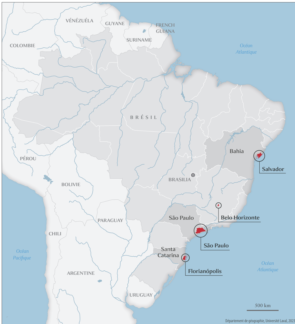
Figure 1 Carte de localisation des métropoles brésiliennes à l'étude.

l'État de Salvador, nord-est du pays, population de plus de 4 millions d'habitants) (figure 1). Le choix de ces agglomérations s'est fait sur la base des contacts établis dans les universités à partir du réseau sur les politiques publiques en Amérique latine dont la première auteure est membre. Aussi, les différents degrés de développement des initiatives d'AUP ont motivé ce choix afin d'obtenir un panorama le plus large possible des différentes applications et expériences au Brésil. Fait important à noter, la ville de São Paulo s'est démarquée en établissant les premières lois