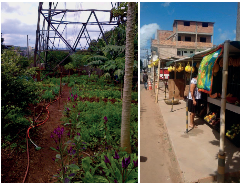
Figures 4 Vues d'un jardin communautaire à São Mateus géré par l'ONG Cidades sem Fome sous les lignes de tension, zone de l'est de São Paulo, et point de vente d'un jardin communautaire de la vallée du fleuve Vermelho à Salvador de Bahia.

La ville de Florianópolis, dans l'état de Santa Catarina au sud du Brésil, se démarquait par des initiatives prometteuses en agriculture urbaine en 2016 lors de notre visite. Les premiers partenaires à l'origine de ce mouvement sont les étudiants et leur professeur de l'Université Fédérale de Santa Catarina, qui ont formé le réseau SEMEAR (semier en français) en collaboration avec les ministères de la Santé et de l'Éducation de la ville. Des rencontres hebdomadaires donnaient le ton aux avancées qui avaient pour but de définir une politique publique d'AUP, en prenant comme base de référence le Programme municipal d'agriculture