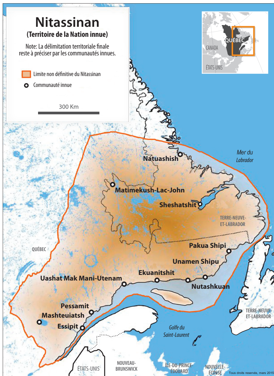
FIGURE 1 Carte du Nitassinan de l'ensemble des communautés innues du Québec et du Labrador

Les premiers allochtones de Natashquan étaient des pêcheurs madelinots, descendants des Acadiens ayant vécu la déportation de 1755. C'est en 1855, lorsque la région s'est ouverte au peuplement libre, après l'abolition des privilèges de la Compagnie de la Baie d'Hudson dans le Domaine du Roi en 1852, que cinq familles s'y installèrent sous l'œil attentif des Innu-e-s (Charest, 2010; Maltais-Landry, 2015). Arrivés à bord de leurs propres goélettes, les pêcheurs étaient surtout de petits entrepreneurs