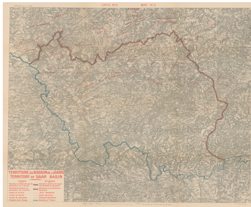
FIGURE 2 Délimitation du territoire du bassin de la Sarre selon le traité de Versailles (1919)

D'où l'impossibilité, d'après Vidal, de comprendre cette région sans considérer les répercussions frontalières qui en découlèrent, au cours des derniers siècles. C'est ce à quoi l'auteur du chapitre s'emploie par la suite en retraçant l'évolution de la frontière du territoire sarrois depuis la période de Louis XIV, époque où la France en vint à y tenir un rôle déterminant. Le premier fait marquant, indique Vidal, fut la fondation de Sarrelouis en 1680 (figure 3), quand le royaume de France se substitua au duché de Lorraine (traités de Nimègue, 1678-1679). Son rayonnement immédiat fut tel qu'«[o]n put croire un moment que Sarrelouis deviendrait la capitale d'une nouvelle province» (BS: 14) du royaume de France. Car depuis cette ville, la France aurait exercé une force unificatrice «au cœur de régions livrées au morcellement» ( ibid. ).