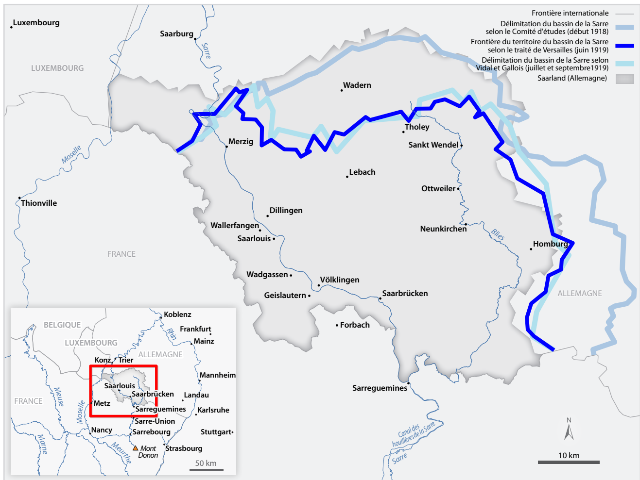
FIGURE 1 Le territoire du bassin de la Sarre selon le Comité d'études (1918) et selon le traité de Versailles (1919) | Réalisation : Mercier et Tremblay-Breault