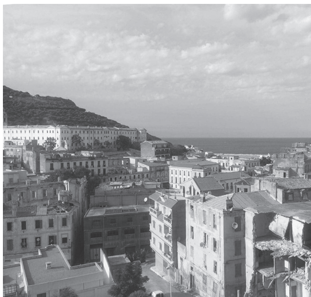
FIGURE 2 Vue sur le quartier Sidi El Houari

Sur le plan historique, le quartier présente une stratification urbaine de 11 siècles, résultat du passage de plusieurs civilisations : antique, arabo-musulmane, espagnole, ottomane et française. Cette stratification a donné lieu à la constitution de plusieurs entités urbaines formant le quartier : 1) la Casbah, fondée en 902 ; 2) l'ancien château de Rosalcazar, aujourd'hui nommé Château-Neuf, construit durant la première époque de la colonisation espagnole, à partir de 1347 ; 3) le quartier de la pêcheurie ; 4) la Calère, une entité construite durant la deuxième occupation espagnole, entre 1509 et 1708 ; 5) la Blanca, édifiée durant la première conquête ottomane, entre 1708 et 1732 ; 6) le quartier Imam Sidi El Houari ; 7) le quartier juif Derb El Houd, bâti durant la seconde période ottomane, à partir de 1792 ; 8) enfin, l'extension coloniale, édifiée durant l'occupation française, entre 1832 et 1962 (figure 1).