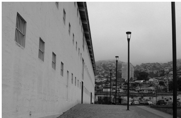
FIGURE 2 La cour du parc culturel Valparaíso. À gauche, la galerie de l'ancienne prison restaurée; au fond, le cerro Cárcel et les collines environnantes